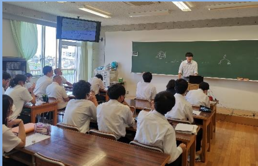
倫理×物理 「大乘仏教と量子力学」