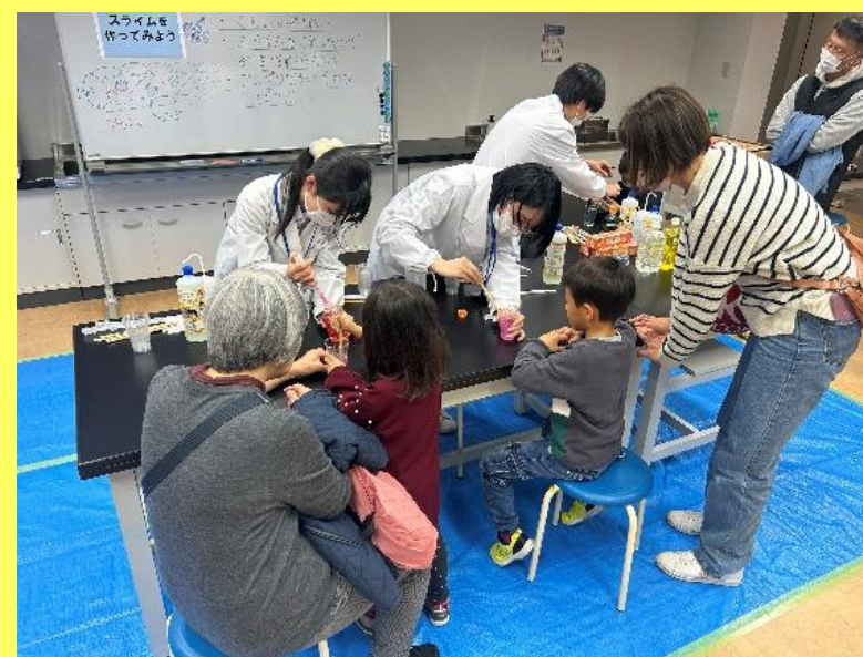
千葉市科学館連携講座 （高校生による科学実験教室）