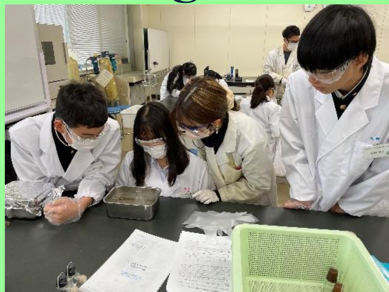
東邦大学 「機器分析講座」

「将来は科学者を目指したい」、「科学を学び続けたい」という“Scienceの芽”を育てます。