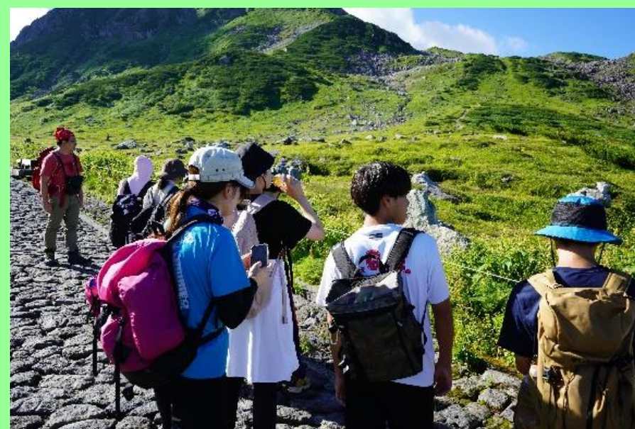
立山での野外実習 (SS-Science Camp II)