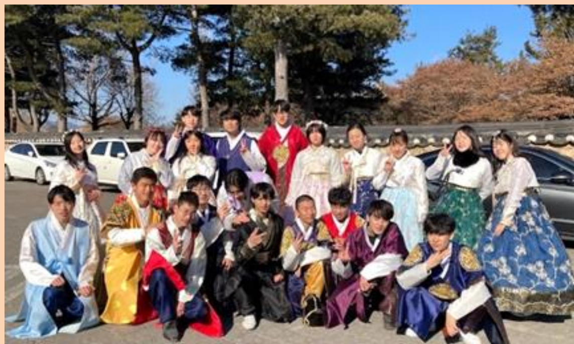
韓国 蔚山科学高等学校との交流

令和5年度より『世界へ羽ばたく科学技術人材の育成プログラム』を行っています。1年次には韓国の蔚山科学高等学校と共同課題研究やホームステイを含む交流プログラムを行い、2年次にはタイで研究発表会を行います。