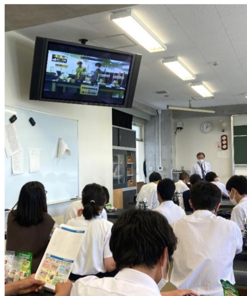
写真2 実験視聴の様子