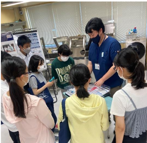
写真5, 6は実際の被ばく患者に対する処置室の様子である。ここでは実際に患者に対してどのような処置を行うのか。また、被ばくをした際の対処について学んだ。受講した生徒たちは、放射線が目に見えないからこそ正しい対処が必要だと実感していた。