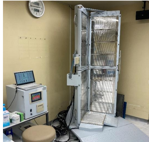
写真5, 6 放射線治療室での見学の様子