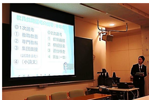
本年度の採用試験の概要