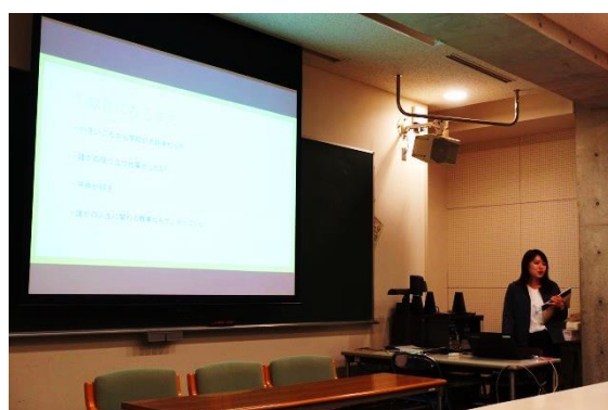
渡邊先生より後輩に向けメッセージ