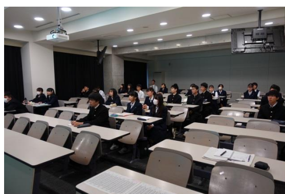
講師の話に熱心に耳を傾ける生徒たち